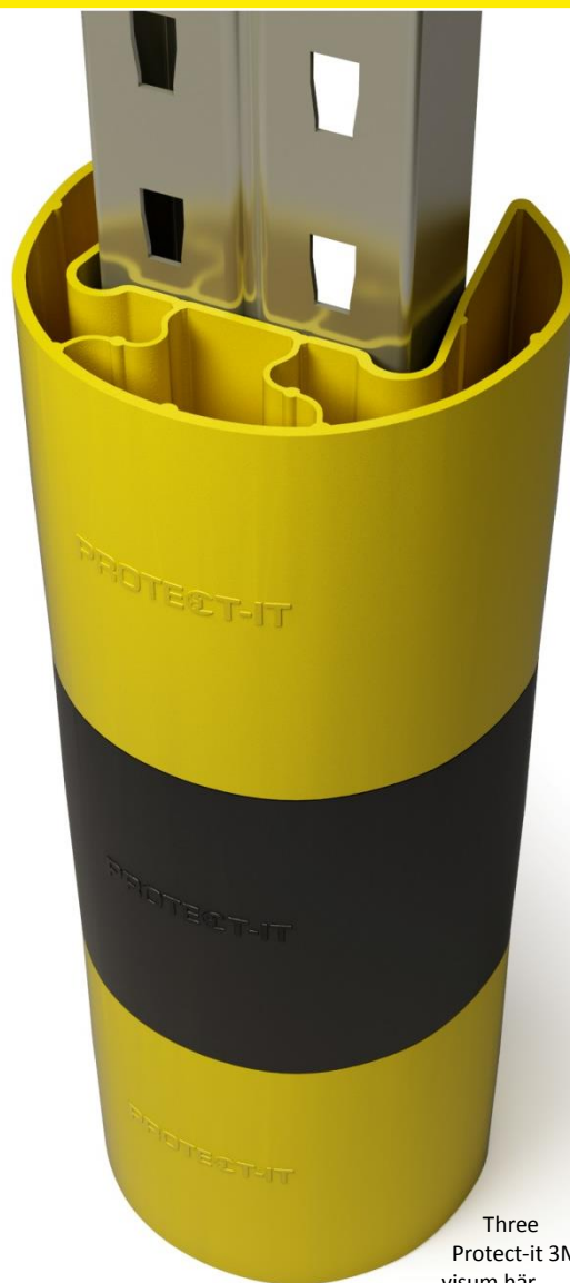
Three Protect-it 3M's visum här